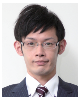
トリミングデータ 良い例

下のようなお写真は印刷が綺麗に仕上がらない場合がございます。 十分ご注意下さい。